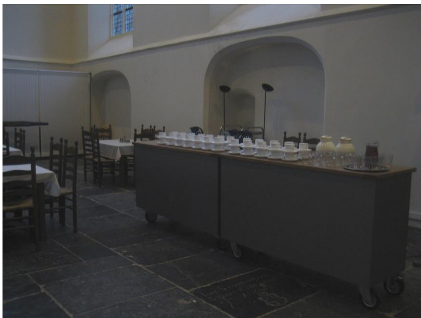
Koffiehoek (variabele opstelling)