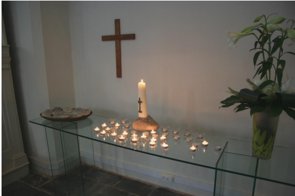
Gedenkhoeck voor overleden gemeenteleden Barbara Gemeente