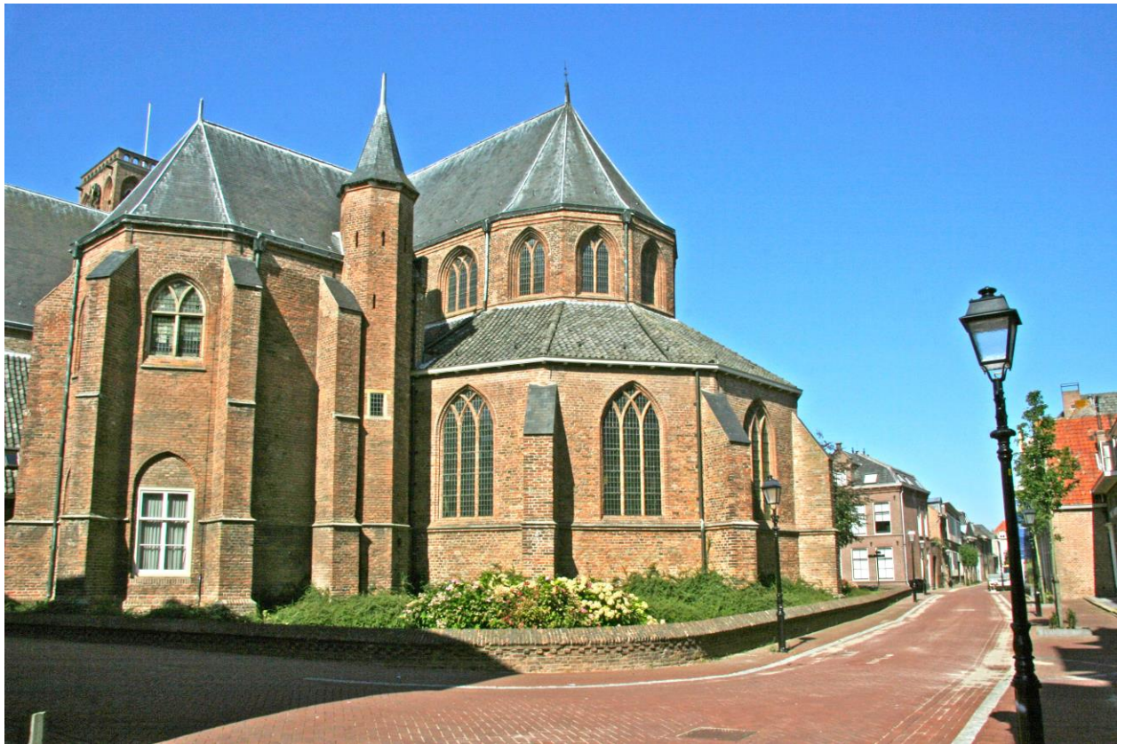
Grote of Barbarakerk Culemborg PKN – Barbara Gemeente Grote Kerkstraat 4, 4101 CB Postbus 123 – 4100 AC Culemborg