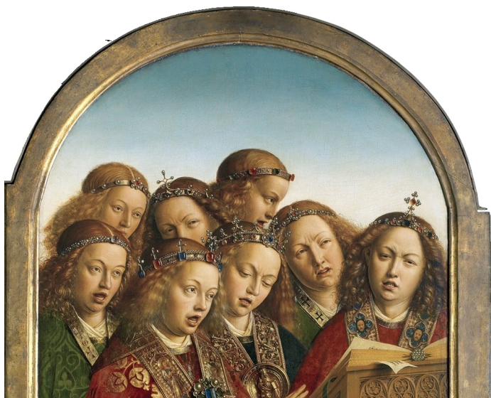
'Zingende engelen' – fragment altaarstuk J. van Eyk (1432)